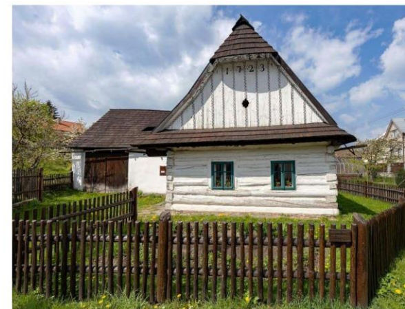
Bystré čp. 137 (okres Svitavy).

konané u příležitosti 170 let od narození Terézy Novákové